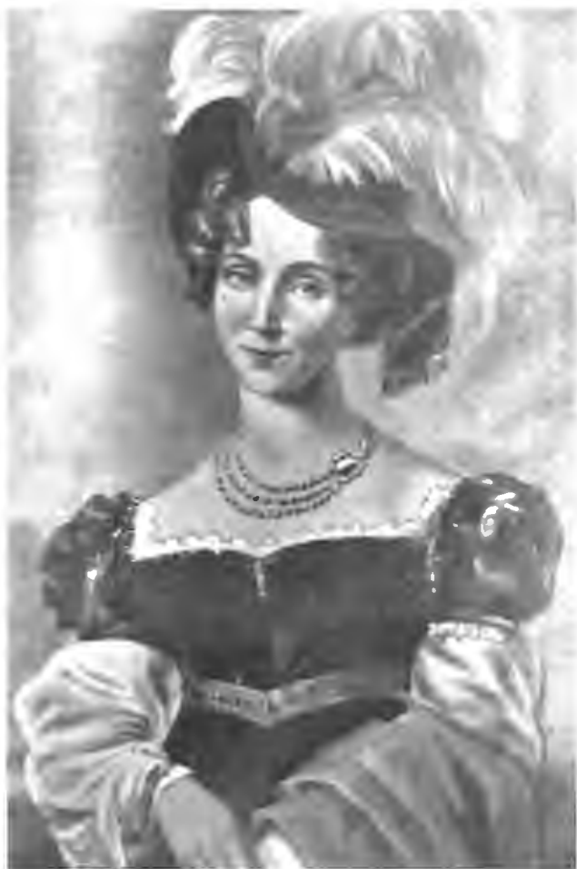
Императрица Елисавета Алексѣевна въ послѣдніе годы жизни. Съ портрета Доу.