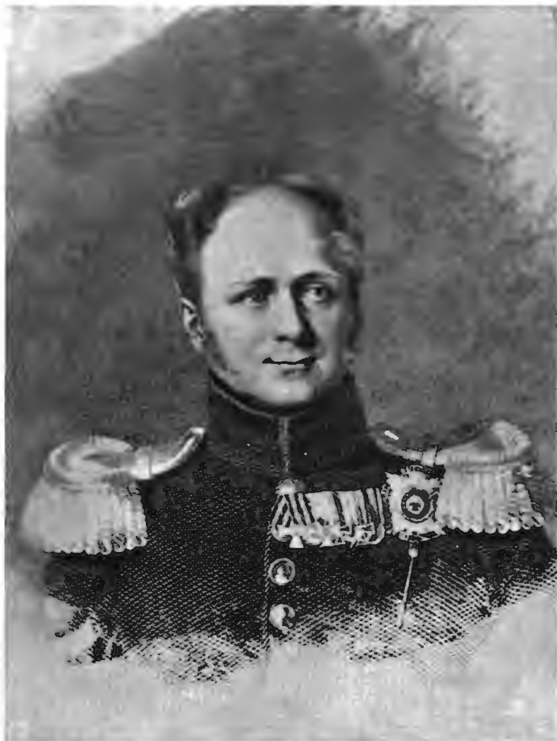
Императоръ Александръ I.