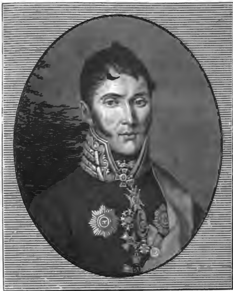
Баронетъ Я. В. Вилліе. Съ современнаго портрета.